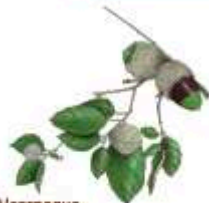
Alcornoque Quercus suber

El águila imperial ibérica sigue teniendo su gran asentamiento mundial en estas sierras, igual que el buitre negro. Águila real, alimoche y halcón peregrino en el roquedo, búhos reales, incontables palomas torcaces invernantes, cigüeña negra, milano, águila perdicera y calzada, alcotán, perdiz roja, arrendajo, rabilargo, y un sinnúmero de pequeñas aves. Una alta densidad de ciervo, gamo, muflón y jabalí. Las últimas citas de lobo se remontan a la década de los noventa, pero abundan meloncillo, gineta, garduña y gato montés. En los ríos, galápago leproso y europeo, nutria, martín pescador, martinete, garza y garceta, pescando barbo comizo, pardilla, calandino o boga.