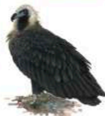
Buitre negro Aegypius monachus