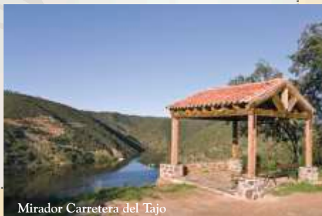
Mirador Carretera del Tajo