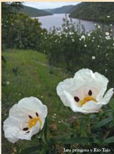
Jara pringosa y Río Tajo

El Parque Natural afecta a ocho de los nueve municipios que conforman la Mancomunidad de Sierra de San Pedro, por lo que una buena forma de conocerlo es usar la Ruta Autoguiada Mancomunidad de Sierra de San Pedro, que recorre en tres jornadas todo su territorio, incluido el del Parque Natural. Además, hay editado un folleto para el visitante que contiene todas las indicaciones necesarias para llevarla a cabo. Siempre hay que recomendar las visitas a los Centros de Interpretación, en este caso El Péndere , que está situado en una antigua ermita dentro de la población de Santiago de Alcántara, y el Aula de la Naturaleza Tajo-Sever, en Cedillo. De la red de miradores se pueden recomendar por su accesibilidad: el Mirador de la Carretera del Río Tajo , y el del Río Tajo propiamente dicho, ambos en la antigua carretera que sale de Herrera de Alcántara y muere en el agua. Hay otro mirador de reciente construcción en la carretera entre Cedillo y la presa, totalmente accesible y que ofrece buenas vistas del Tajo. El Mirador del Arroyo Negrals , ofrece unas vistas impresionantes, y aunque hay que llegar por pistas forestales desde la población de Herrera de Alcántara, se puede hacer en automóvil. Lo mismo que el de La Carrasquera, desde Cedillo. Todos ellos ofrecen buenas posibilidades de observar fauna y flora, sobre todo aves, y están perfectamente señalizados sus accesos. No hay que olvidar recomendar los atractivos conjuntos dolménicos de Cedillo y Santiago de Alcántara.