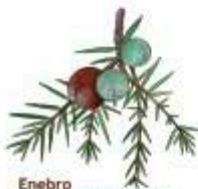
Enebro Juniperus oxycedrus