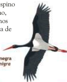
Cigüeña negra Ciconia nigra