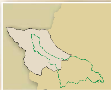
— Límite Z.I.R. Sierra de San Pedro.

El área protegida se encuentra sobre la Sierra de San Pedro, que forma junto con otras cadenas montañosas del centro de Extremadura, la línea divisoria entre las cuencas de los ríos Guadiana y Tago, a las que vierte sus aguas. El núcleo central de este gran espacio está constituido por sierras de mediana o baja altitud que no sobrepasan los 700 metros y que generalmente, siguen una dirección noroeste. Las 115.032 ha protegidas de este vasto espacio, se extienden a ambos lados de la línea que marca los límites provinciales entre Cáceres y Badajoz, afectando a siete términos municipales de la Mancomunidad de Sierra de San Pedro: San Vicente de Alcántara, Valencia de Alcántara, Santiago de Alcántara, Carabajo, Membrío, Salorino y Herrerueta. La extensión y continuidad del manto forestal que la cubre, convierte la Sierra de San Pedro en una de las zonas boscosas más importantes de la Península Ibérica, representando la esencia misma del bosque y matorral mediterráneos.