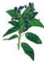
Durillo Viburnum tinus