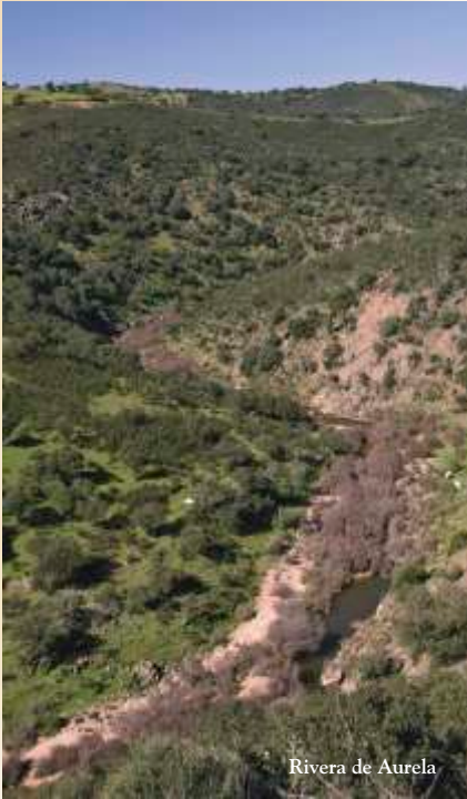
Rivera de Aurela

El área protegida en las cercanías del Tajo está ceñida a las laderas que lo rodean, a la desembocadura del río Salor y a las riveras de Carbajo y Aurela, mientras que se prolonga en toda la longitud del río Sever, extendiéndose por la cuenca española del río y parte de la del Alburrel. Por lo tanto es un espacio con forma de hilo que sigue los principales cursos de agua. Este territorio, situado fuera de las principales vías de comunicación y fuertemente determinado por su posición fronteriza con Portugal, ha desarrollado un modelo de evolución demográfica y económica, que ha contribuido al buen estado de conservación del medio natural de la zona. A esto hay que sumarle la conservación de la orilla opuesta, que ostenta hace tiempo la categoría de Parque Natural do Tejo Internacional.