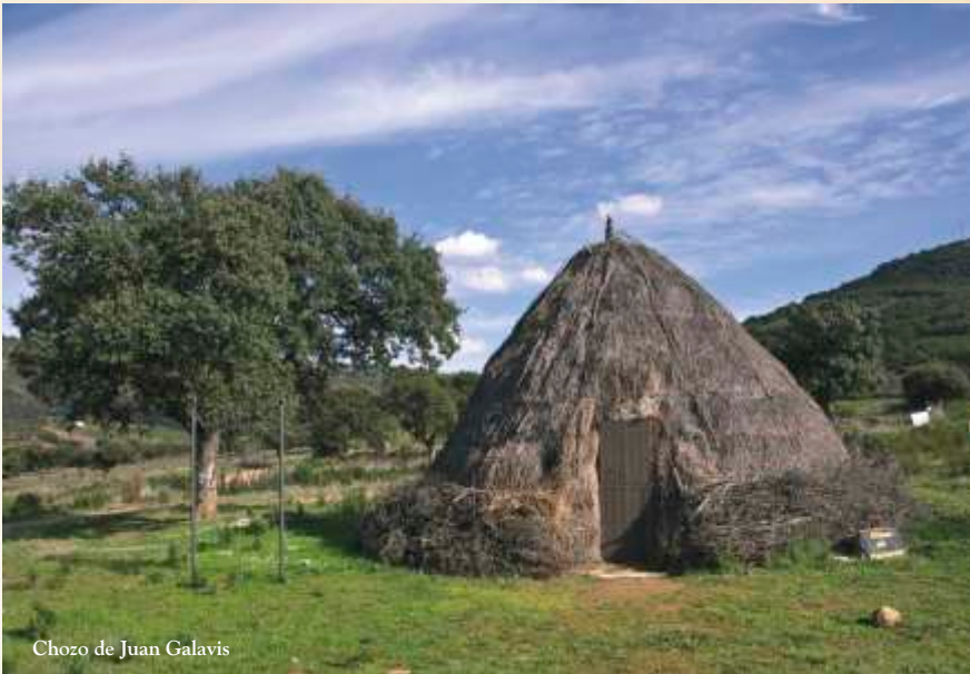
Chozo de Juan Galavis

El área protegida en las cercanías del Tajo está ceñida a las laderas que lo rodean, a la desembocadura del río Salor y a las riveras de Carbajo y Aurela, mientras que se prolonga en toda la longitud del río Sever, extendiéndose por la cuenca española del río y parte de la del Alburrel. Por lo tanto es un espacio con forma de hilo que sigue los principales cursos de agua. Este territorio, situado fuera de las principales vías de comunicación y fuertemente determinado por su posición fronteriza con Portugal, ha desarrollado un modelo de evolución demográfica y económica, que ha contribuido al buen estado de conservación del medio natural de la zona. A esto hay que sumarle la conservación de la orilla opuesta, que ostenta hace tiempo la categoría de Parque Natural do Tejo Internacional.