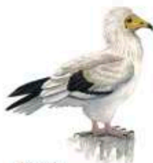
Alimoche Neophron pernocterus

El encinar predomina en los riberos, en asociaciones vegetales con jara, jaguarzo, cantueso y lentisco. El efecto termorregulador de la masa de agua propicia el desarrollo de alcornoque y quejigo en las umbrías, y especies arbustivas asociadas a este grado de humedad, como coscoja, mirto, aladierno, durillo o brezo blanco. En las solanas, acebuche, enebro, piruétano y espino negro. En los cauces, sotos de aliso, fresno, sauce y bosquetes de almez, y en los tramos altos del río Sever, una notable presencia de melojo y castaño.