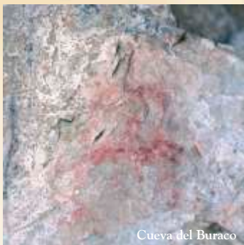
Cueva del Buraco