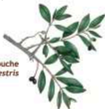
Acebuché Olea europea var. silvestris