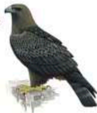
Águila real Aquila chrysaetos

Destacan las citas invernales de águila pescadora y la colonia de buitre negro nidificante. Los farallones inaccesibles junto al agua acogen cigüeña negra, águila y búho real, águila perdicera, alimoche, halcón peregrino, buitre leonado y un sinfín de pequeñas aves. Se especula con la presencia del lince ibérico, mientras que la realidad del lobo se queda en la consideración de la zona como corredor natural con las poblaciones norteñas. Pero gato montés, gineta, meloncillo, nutria, garduña y tejón, campan a sus anchas por los riberos junto a una notable población de ciervo rojo y jabalí. El Tajo y sus afluentes conservan comunidades de peces cuya captura forma parte de la cultura rayana: calandino, colmilleja, pardilla, boga y barbo comizo. El río Sever además, ofrece refugio a especies tan peculiares en estas latitudes como el galápago europeo, lagarto verdinegro o cangrejo de río autóctono.