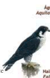
Halcón peregrino Falco peregrinus