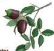
Encina Quercus rotundifolia