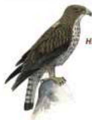
Águila perdicera Hieraaetus fasciatus