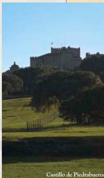
Castillo de Piedrabuena