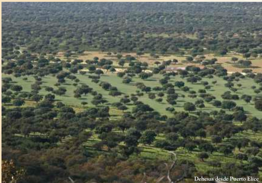
Dehesas desde Puerto Elice