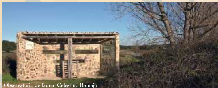
Observatorio de fauna Celestino Ramajo