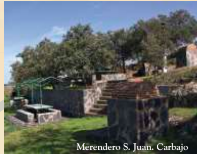
Merendero S. Juan. Carbajo

La Dirección del espacio, sólo tiene rutas establecidas para automóvil en las zonas que afectan a la mancomunidad y además coinciden en gran medida, con las jornadas dos y tres de la Ruta Autoguiada. La única ruta establecida es la llamada Senda del Águila perdicera, que es la subida al Mirador de Cabeza del Buey, y que también está incluida en la Ruta Autoguiada. No obstante enumeramos algunas rutas de senderismo señalizadas que son óptimas para la observación de fauna y flora: