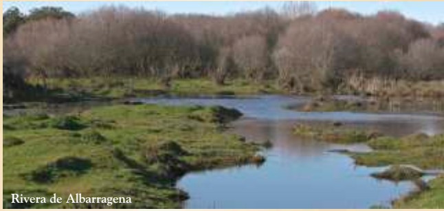
Rivera de Albarragena